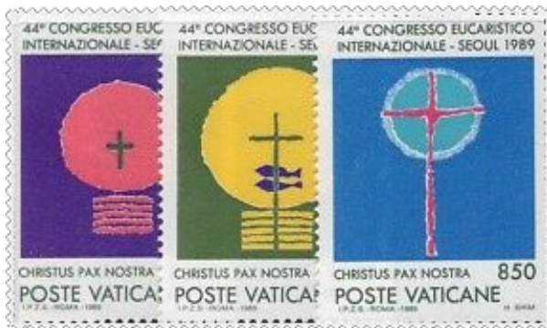
Vatikáni bélyegek a szöuli kongresszusra

XLIV. kongresszus: 1989. Szöul – Korea. „Krisztus a mi békénk” – A kongresszus mottója különösen is kifejezte a kettéosztott koreai félszigeten élők béke- és kiengesztelődésvágyát. A kongresszus szinte összes rendezvényén felsejlett a megosztottság fájó sebébe. Az akkor kb. 40 milliós országban 2 millió ember vallotta magát katolikusnak, s a hívők fele az azt megelőző tíz évben keresztelkedett meg. Ezért különösen is felemelő volt a résztvevők szerint, amikor a Szentatya a szombat esti, ifjúsági szentmisén tizenkét 20 év körüli fiatalnak szolgáltatta ki a beavató szentségeket.