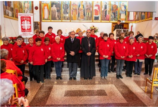
A díjazott lenti csoport a szombathelyi Jézus Szíve templomban

2018 novemberében a Lenti Karitászcsoportot az önkéntesek áldozatos munkájáért a Szombathelyi Egyházmegyei Karitászdíszoklevéllel jutalmazta.