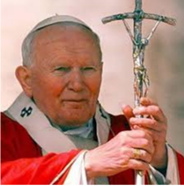
Szent II. János Pál pápa

„A szabadság nem egyszerűen a zsarnokság vagy az elnyomás hiánya. Nem is felszabadítás arra, hogy azt csináljunk, amit akarunk. A szabadságnak megvan a maga belső logikája, amely megkülönbözteti és megnemesíti: a szabadság az igazsághoz van rendelve, és abban teljesedik ki, hogy az ember keresi az igazságot és benne él abban.”