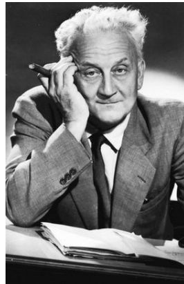
Szent-Györgyi Albert Nobel-díjas magyar biokémikus

„Uram, mentsd meg gyermekeinket. Mentsd meg értelmüket, hogy romlottságunk ne rontsa meg őket. Mentsd meg életüket, hogy fegyverek, melyeket mások ellen kovácsolunk, ne őket pusztíthassák, hogy jobbak lehessenek szüleiknél, hogy építhessék önnön világukat, a szépség, tisztesség, összhang, jóakarát és méltányosság világát. Melyet a béke és a szeretet kormányoz Mindörökké.”