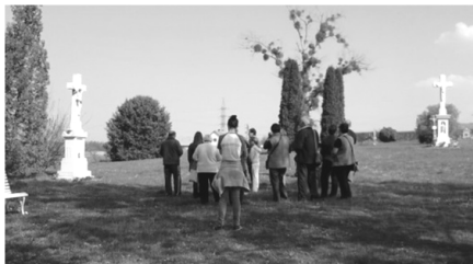
A zarándokok a lentiszombathelyi temetőben.

Legutóbbi zarándoklatunk a kerékpáros keresztút volt március 29-én, szombaton. Nagyon szép tavaszi napsütésben indult a csoport. Első állomás a lenti templom volt. A temetőn át vezetett az út a máhomfai temetőhöz. Innen a zarándoklat legszebb szakasza következett, az erdőben kerekeztünk a lentiszombathelyi Mária-fához. Lentiszombathelyen több állomást is érintettük, hiszen itt található a legtöbb kőkereszt. A temetőnél és a Jézus Szíve szobornál is megálltunk.