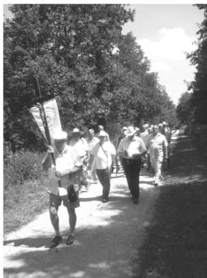
Radamosi gyalogos zarándoklat (2012) a Képviselőtestület szervezésében.

Templomunk Képviselőtestülete 2014. február 23-án 15.00 órakor a templomban tartott fogadalomtétellel megalakult, és ezt követően a Plébánián megtartotta első ülését. Az új testület meghallgatta és elfogadta a 2013. évi zárszámadást, majd az 2014. évi költségvetést tárgyalta meg és fogadta el. Ezután a kisharanggal kapcsolatos tudnivalókról tájékozódott.