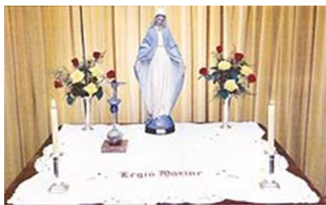
A Mária Légió oltára

taik közt tartják betegeket látogatását is. A szervezet háromféle tagot ismer: aktív tagokat, akik a szerdai összejöveteleken részt vesznek, segítő légiósokat, akik az imákat egyénileg végzik, és pártoló tagokat, akik anyagi segítséget nyújtanak. Érdeklődőket a csoport szívesen fogad.