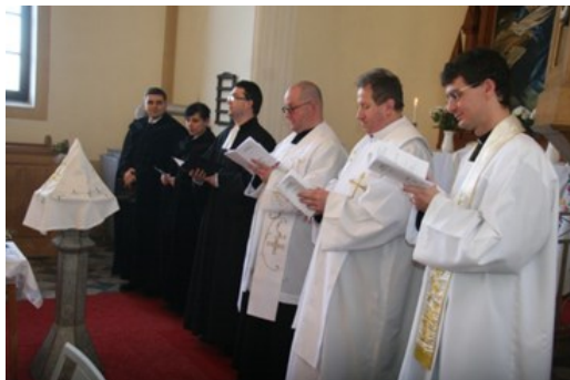
Ökumenikus imaóra Barlahidán 2016-ban