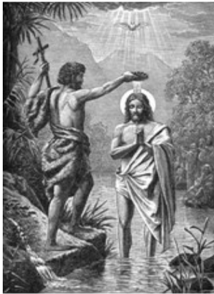
János megkereszteli Jézust

Lukács evangélista tudatja, hogy amikor Mária meglátogatta Erzsébetet , és ő „meghallotta Mária köszöntését, örömeiben megmozdult méhében a gyermek, maga Erzsébet pedig eltelt Szentlélekkel. Nagy szóval felkiáltott: »Áldott vagy az asszonyok között, és áldott a te méhed gyümölcse!«” (Lk 1,41-42)