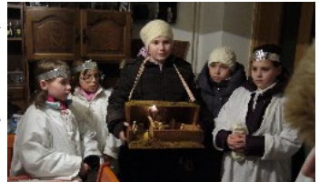
Betlehemező lenti cserkészek