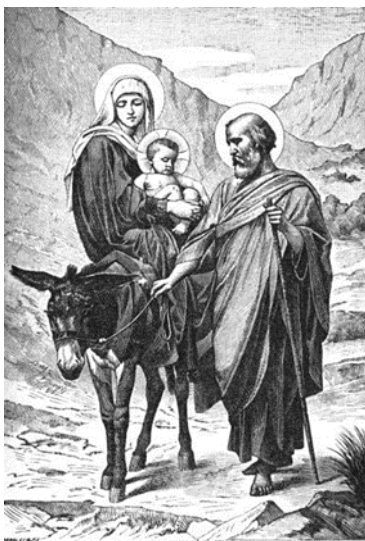
A szent család Egiptomba menekül.

A történelem sokszor állította nehézségek elé a gyermekáldást vállaló családokat. A háborúk idején nem volt garancia arra, hogy a frontról az édesapa visszatér, hogy testi épségben érkezik-e szerettei körébe.