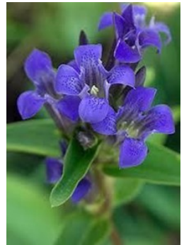
Szent László fűve (lat. Gentiana cruciata )

Amikor László felébredt, az angyal szavai szerint cselekedett. A nyílvesző ahol lehullt, egy genciána fűszálat átütött. A belőle készült kenőcs mentette meg a népet a döghaláltól. A növényt Szent László fűvének nevezi a nép. Keresztes tárnics, Szent László-tárnics néven is ismert.