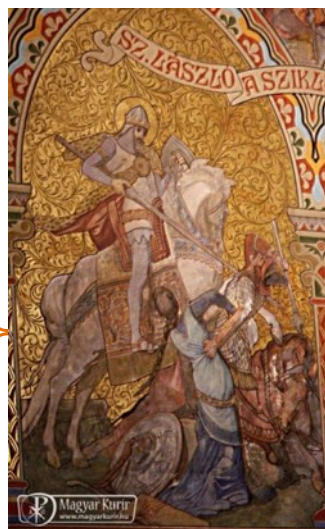
Szent László király a Mátyás templom freskóján

Keresztes vitézek daliás vezére, Mi árva nemzetünk ékessége, fénye. Régi nagy királyunk, dicsőséges László, Kérünk, légy Istennél értünk közbenjáró. Jámborság volt élted virágzó erénye, Szűz Anyánk Szent Fia szívednek reménye. Régi nagy királyunk, dicsőséges László, Kérünk, légy Istennél értünk közbenjáró. Az Isten tégedet csodákkal megáldott, Oh, tekintsd mennyekből e nyomorúságot. Régi nagy királyunk, dicsőséges László, Kérünk, légy Istennél értünk közbenjáró.